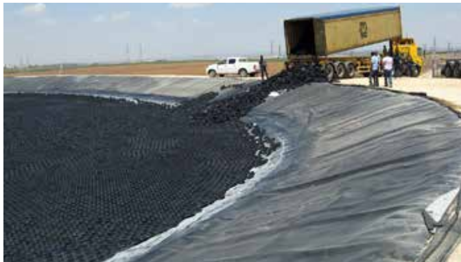
Hexa-Cover® : Automatisk tilpasning til ændret væskniveau