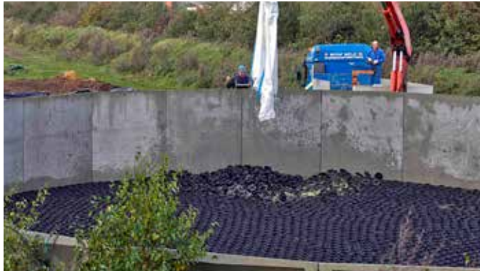
Hexa-Cover® : Installation i tom tank er muligt (max 5m faldhøjde)